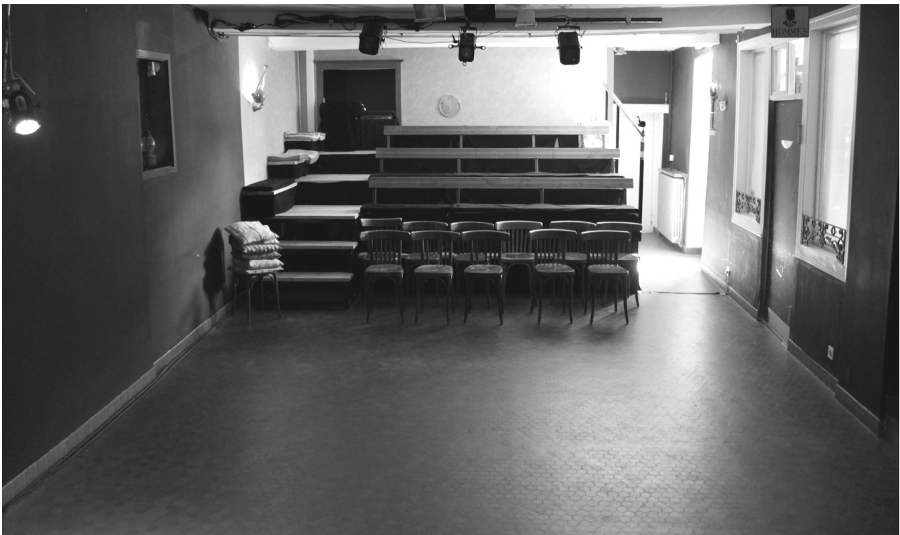
Côté gradins et fosse